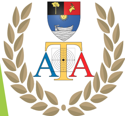
Association de Tir Audengeoise